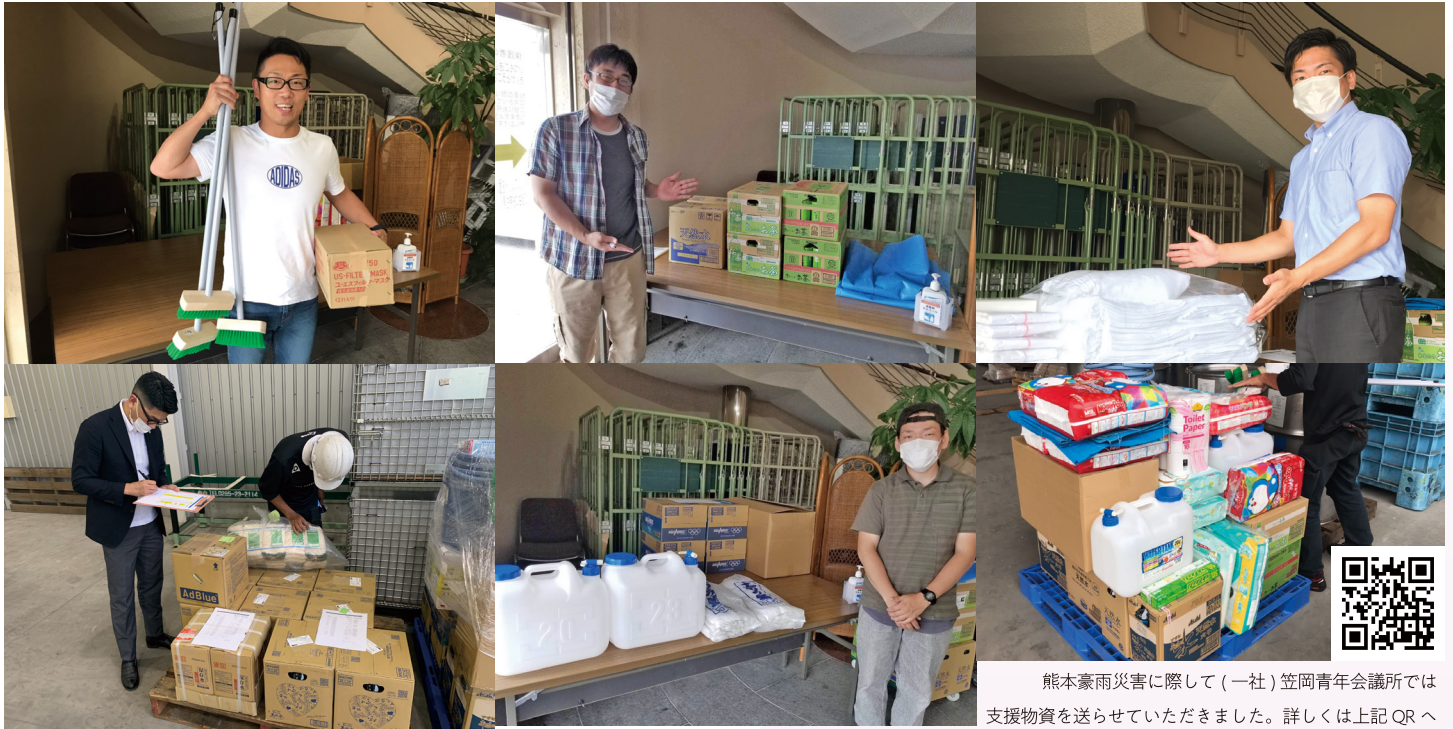
熊本豪雨災害に際して(一社)笠岡青年会議所では支援物資を送らせていただきました。詳しくは上記QRへ